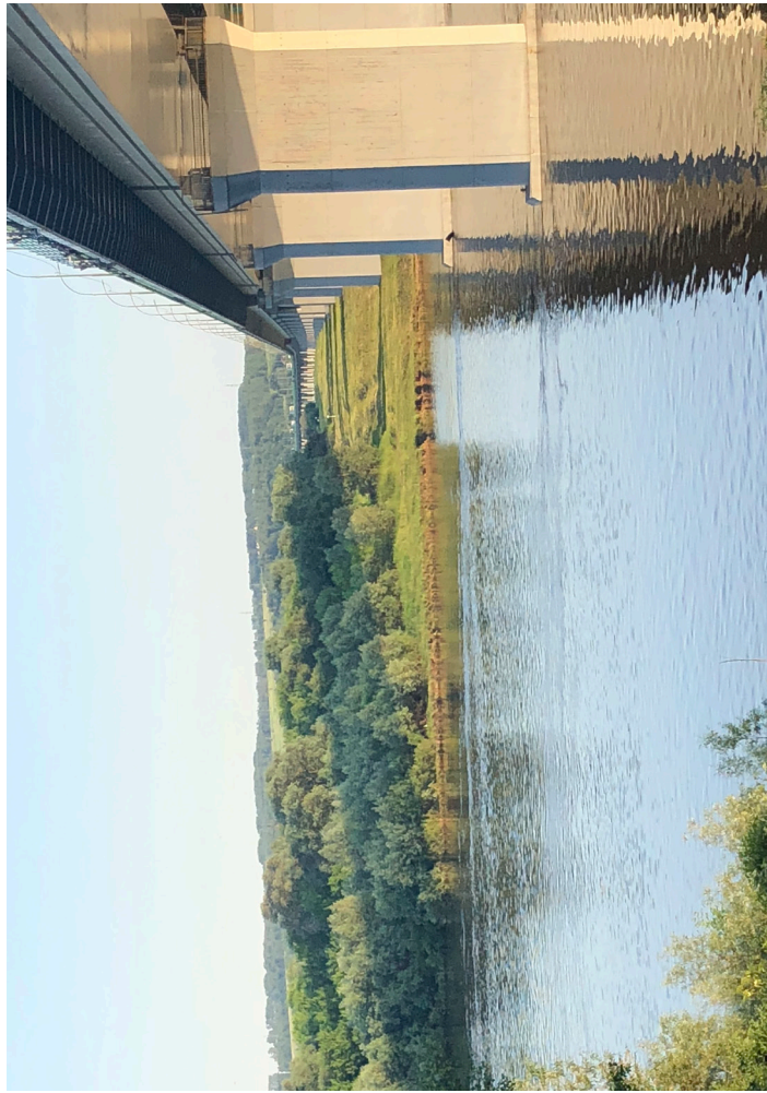
Мост через Оку