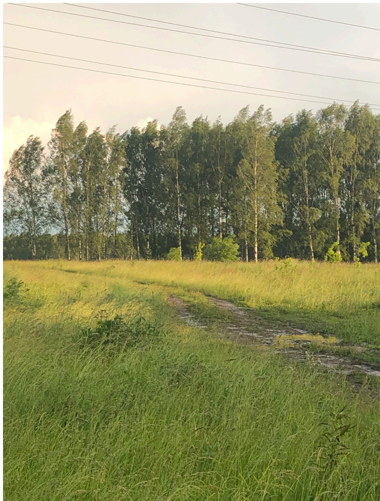
Дорога в березовую рощу в г. Кашира