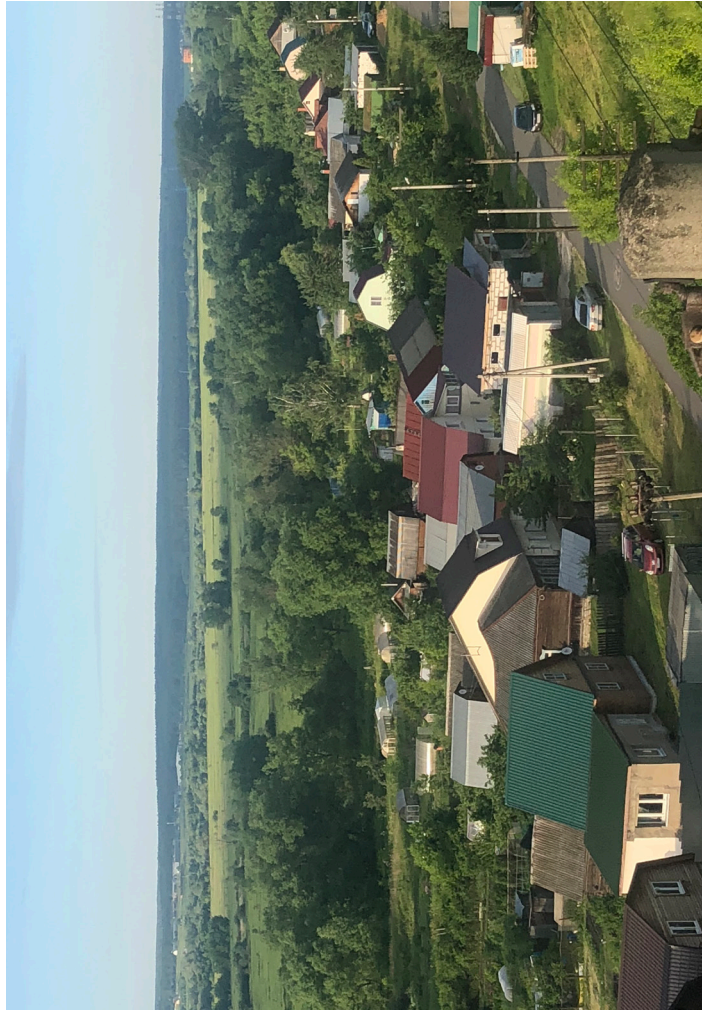
Вид на ул. Чигчерина г. Кашира