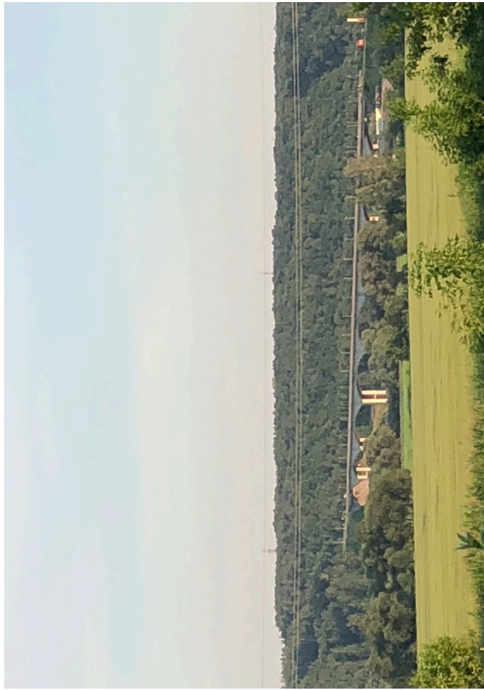
Вид на старый мост через р. Ока