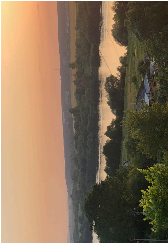
Летний вечер в Кашире