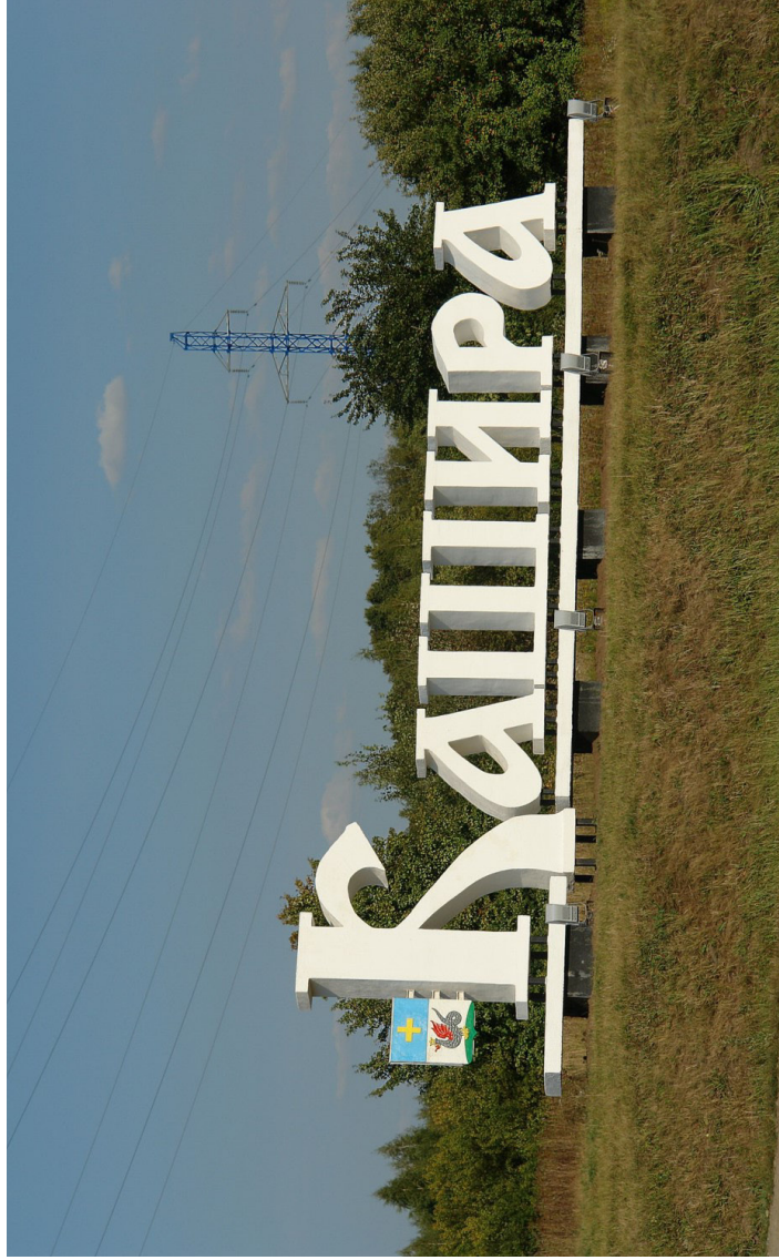
Въезд в город Кашира