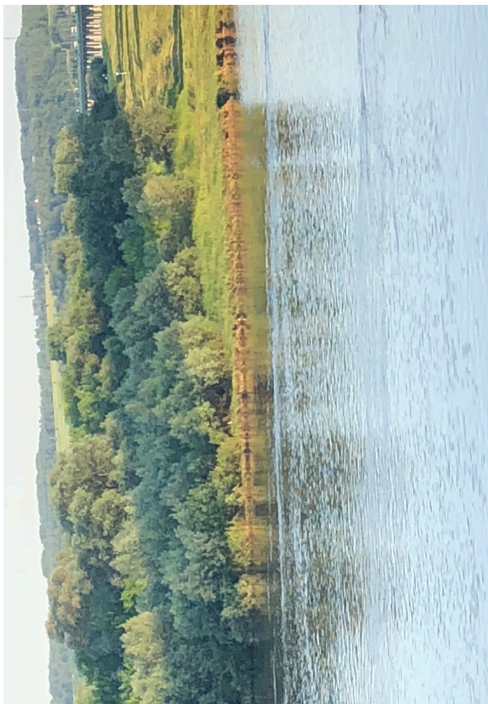
Берег р. Ока