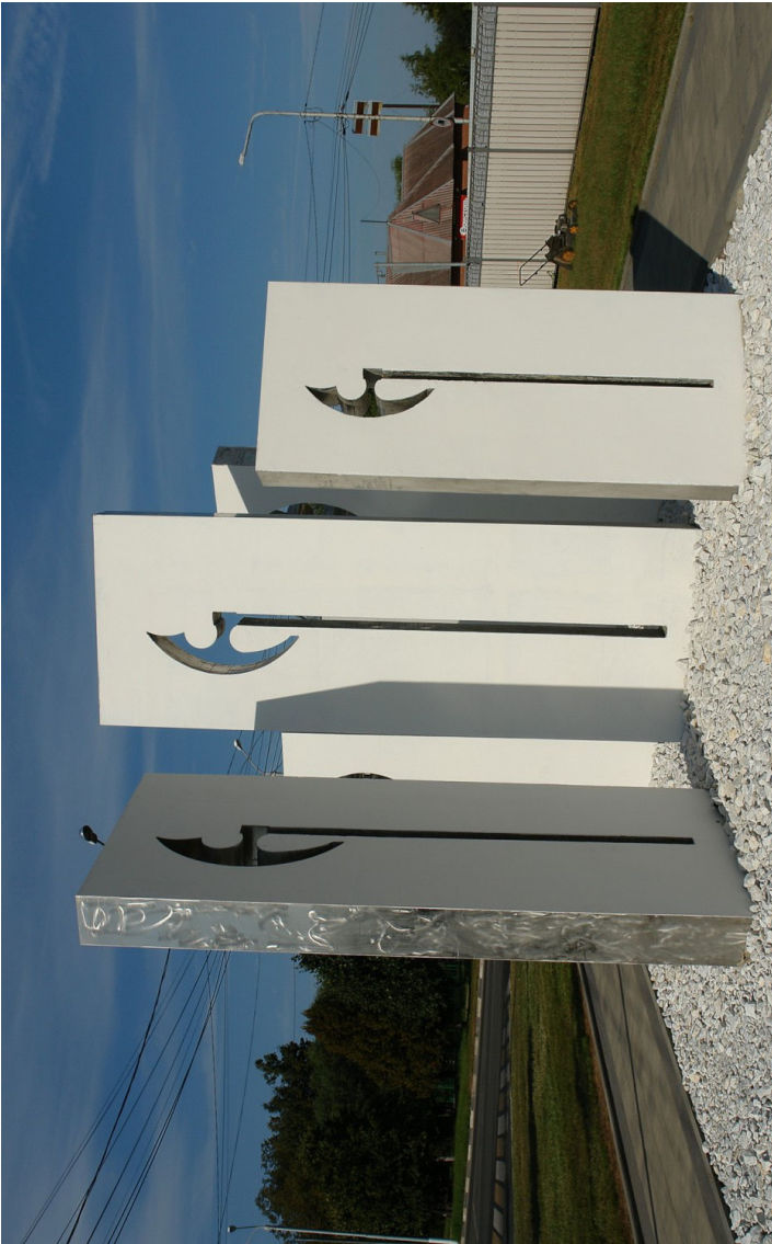
Улица Стрелецкая г. Кашира