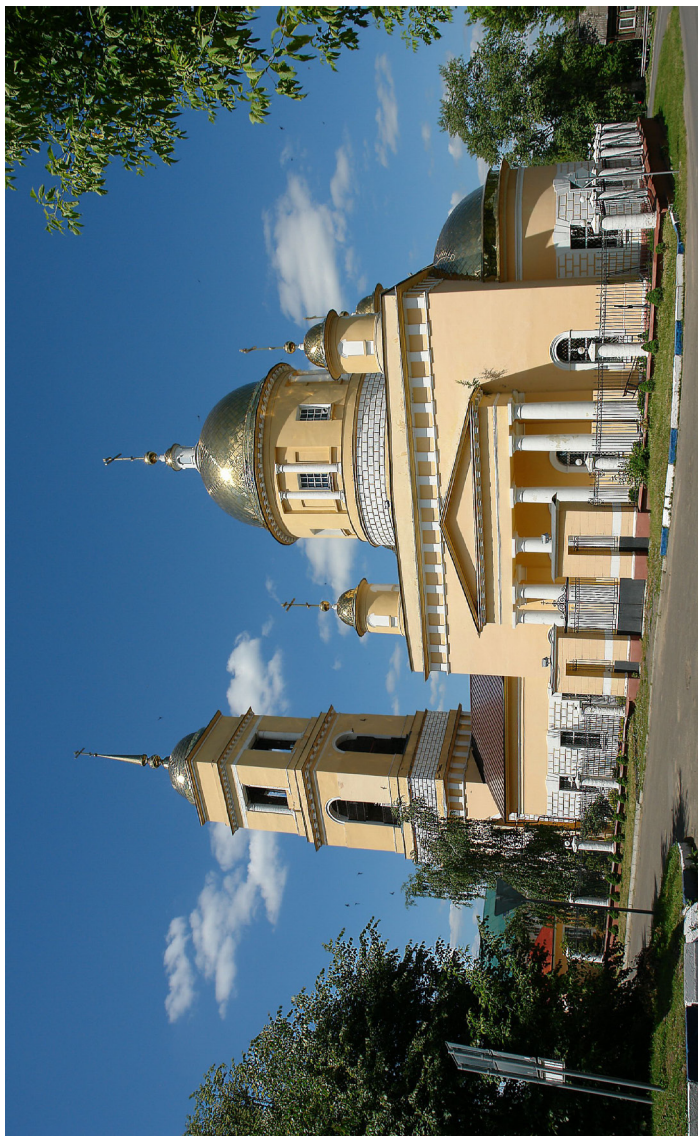
Успенский Собор в г. Кашире