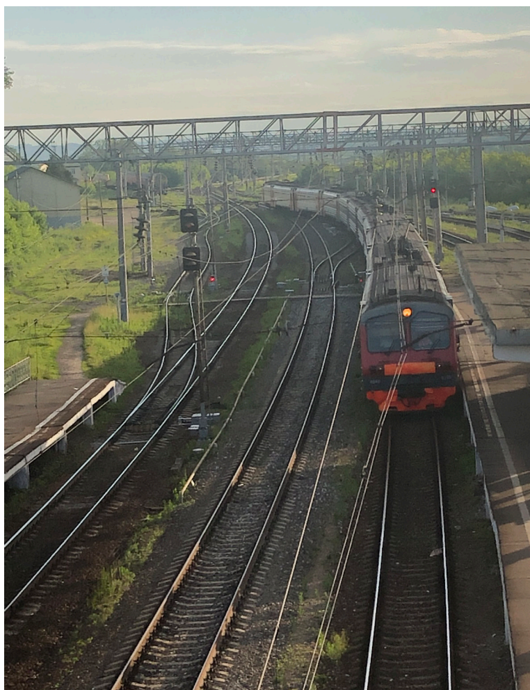
Электropоезд из Москвы в Каширу