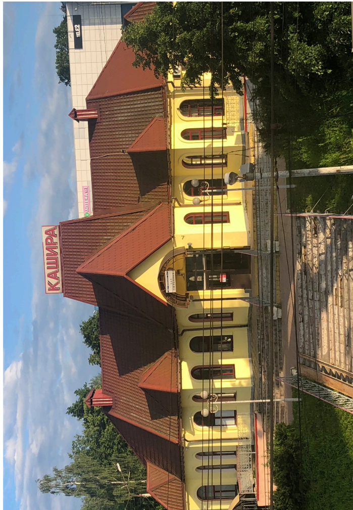
Здание железнодорожного вокзала на станции Кашира