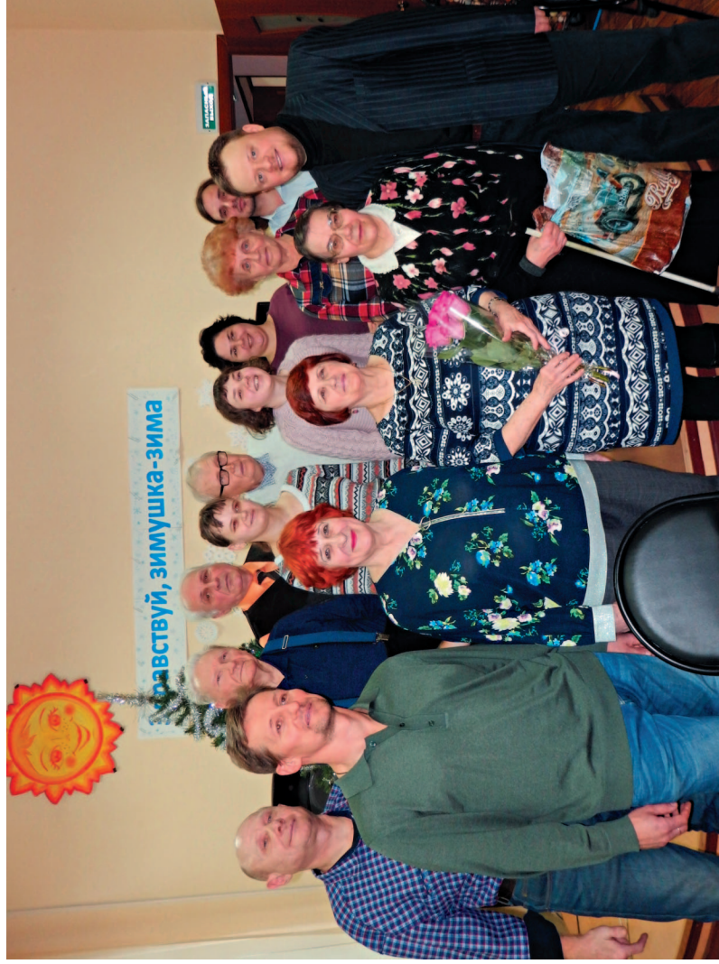
76-е заседание ЛИТО "Зодиак". Детско-юношеская библиотека в Кашире-2 (05.01.2020)