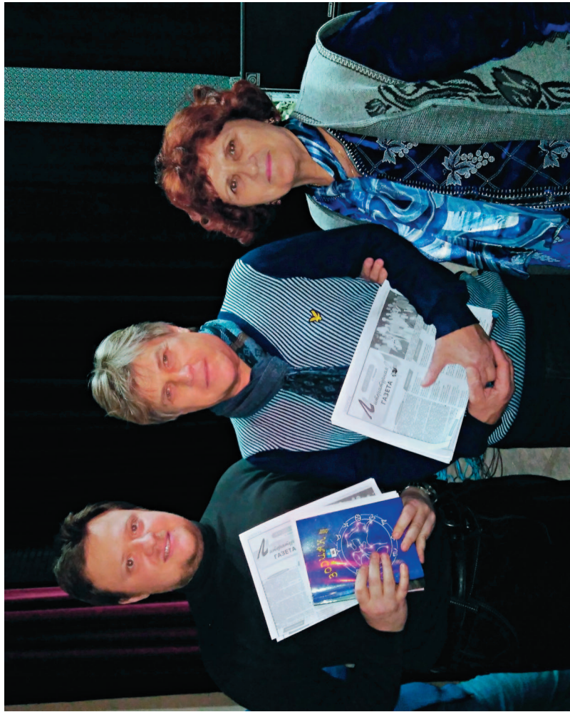
С Алексеем Глызиным в ДК г.о. Кашира (08.03.2017)