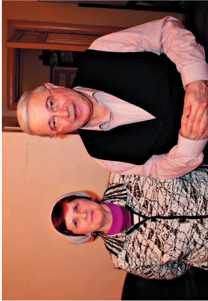
С Евгением Петросяном в ДК г.о. Кашира (31.03.2017)