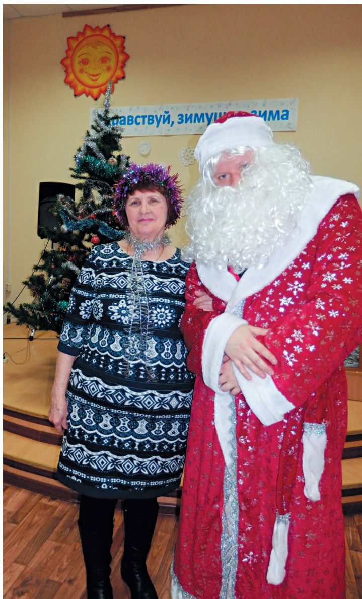
Новый Год для каширского отделения ВОС. Детско-юношеская библиотека в Кашире-2 (26.12.2019)