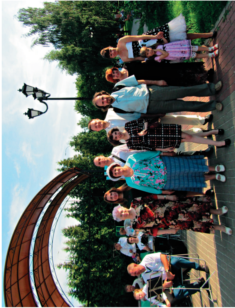
663-летие Кашеры. Поэтическая площадка у АТС (27.07.2019)