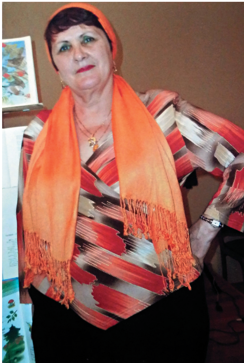
В Центральной библиотеке г. Кашира-2, 2017 г.