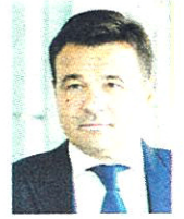
Андрей Воробьев, Губернатор Московской области: