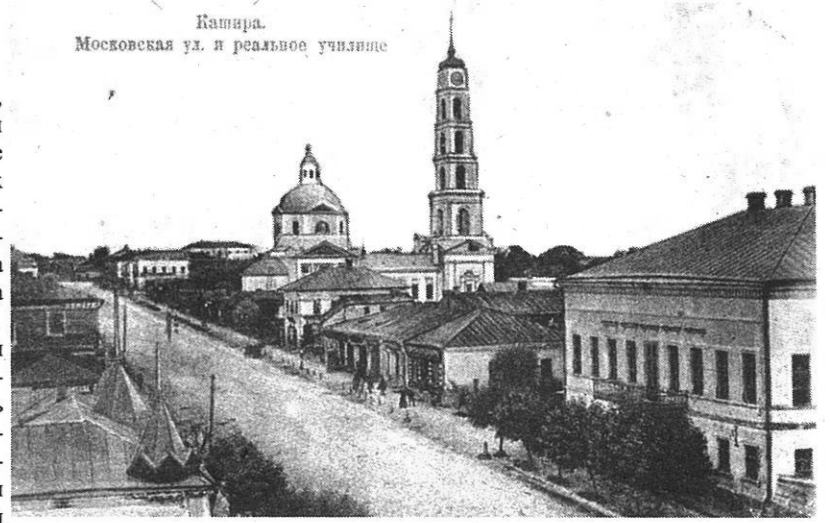
Кашира. Московская ул. и реальное училище

Это были полудеревянные, полукаменные дома с чугунными решетками балконов, с причудливой резьбой наличников и ставней. Принадлежали они каширскому купечеству. Позже были построены дома тяжелой конструкции с громоздкими пилястрами, круглые торговые ряды в виде арок в два яруса. Так застраивалась Кашира на купеческие барыши.