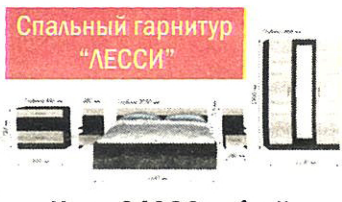
Спальный гарнитур "ЛЕССИ"