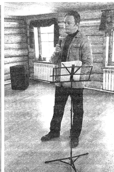
Трудники музея великого артиста Б.В.Щукина: они постоянно ищут что-то интересное, и все их программы пользуются заслуженным успехом.

В каждом исполнении участники концерта приобщали слушателей к возвышенному. Творчество – это поиск, и в Дом творчества люди преклонного возраста, молодежь, дети, инвалиды приходят за интересным. Радуют их со-