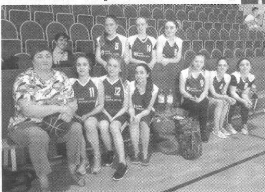
манда девушек школы №7, второе место заняла команда школы №1, а третий результат показала команда школы №4.

18 апреля в баскетбольных матчах принимали участие команды девушек. Победителем спартакиады стала ко-