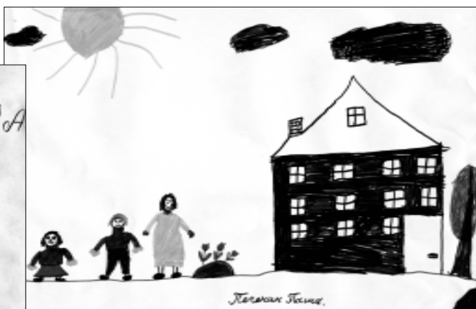
Сегодня мы публикуем рисунки Лизы Перфиловой, Ани Данченко и Паши Печенина.