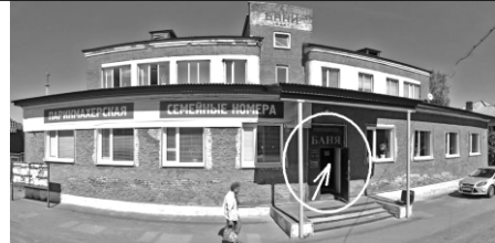
ИЩЕШЬ ЛИТЕРАТУРУ? ИДИ В БАНКО!

Чтобы смело бороться со злом — Получить надо красный диплом. Чтобы радость и счастье вкушать, Восхитительной жизнью дышать, Надо личность свою улучшать И учиться на круглое «Пять»!